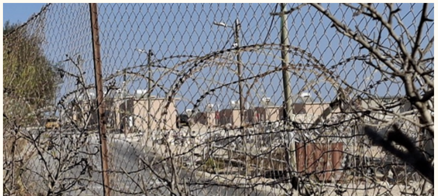
So sieht es wenige Monate später aus.