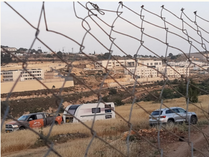
Klein hat der Siedlungsbau begonnen...

Das Ziel dieser Schikanen ist klar: Die palästinensische Landbevölkerung soll zermürbt werden. Sie soll ihre Dörfer und ihr Land aufgeben, ins Ghetto der Stadt oder – noch besser – gleich ins Ausland verschwinden.